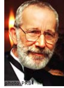
J. Robin Warren

ئەمپۇ كۆمىتەى دابەشكردى خەلاتى نۆبلى سوئدى برىارىدا خەلاتى ناوبراوى ئەمسالى فيزيۆلوژى و پزىشكى بدات بە (Barry Marshall & Robin Warren) لە نەخۇشخانەى Royal Perth ئوسترالىا بۇ ئەو خزمەتە گەورەيەى بە مروقاىەتییان كردووه . رۆبىن تەمەنى 68 ساله ، لە سالانى هەشتاكاندا واتە 21 سال لەمەوبەر لە ئوسترالىا 100 تىستى بەكترياي لە نيوپوؤشى خانەكانى گەدەى چەند نەخۇشكىدا دۆزىيەوه . هەرچەندە ئەو كاتە هەموو پزىشكان واى بۇ دەچوون كە بەكتريا لە نيو ترشەلۆكى گەدەدا ناژى و ھۆى برىنەكە دەگەرپتەوه بۇ نائارامى ، ستايلى ژيان ، خۇراكى توند و تىژ ، مەى . بەلام رۆبىن سوور بوو لە سەر ئەوہى كە ھۆى برىنى سەر گەدە بەكتريايە .