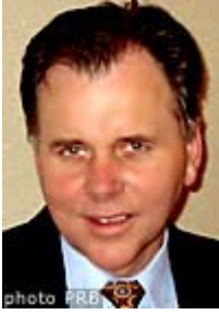
Barry J. Marshall